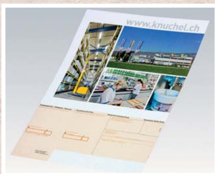
Formular mit ESR

Lieferscheine, Rechnungen, Briefbögen, Vordrucke mit Überweisungsträger